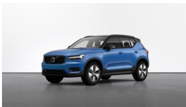
Bursting Blue Metallic Metallic