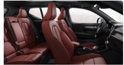
Leather Oxide Red with Driftwood decor