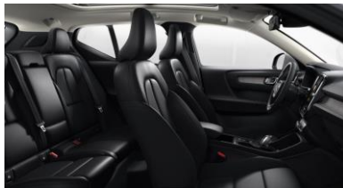
Leather Charcoal with Driftwood decor