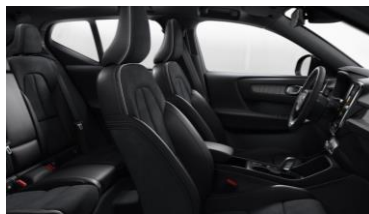
Fine Nappa Leather Charcoal with Cutting Edge Aluminium decor