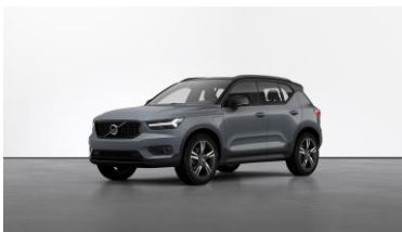
Thunder Grey Metallic