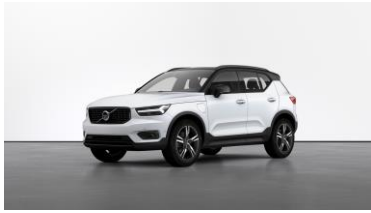
Crystal White Premium Metallic