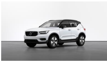
Crystal White Premium Metallic