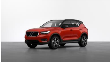
Coral Red Metallic