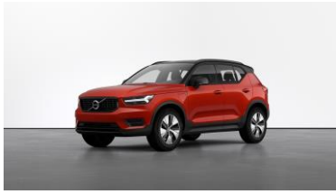
Coral Red Metallic