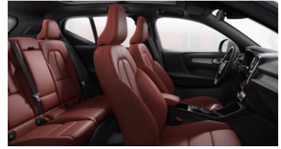
Leather Oxide Red with Driftwood decor