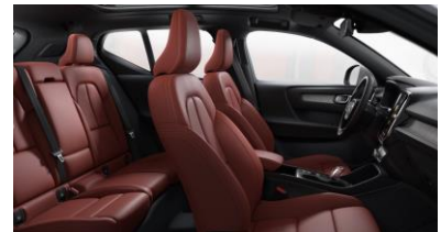
Leather Oxide Red with Driftwood decor