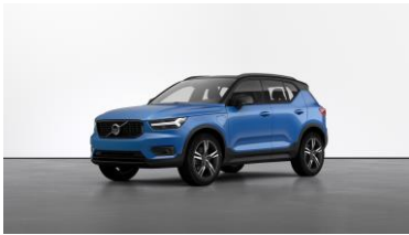
Bursting Blue Metallic Metallic