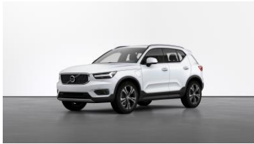
Crystal White Premium Metallic