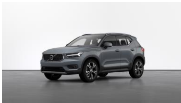
Thunder Grey Metallic Metallic