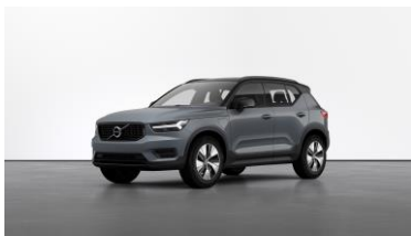
Thunder Grey Metallic