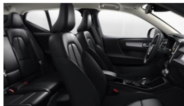
Leather Charcoal with Urban Grid Aluminium decor