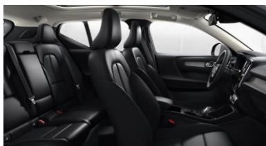
Leather Charcoal with Driftwood decor