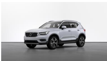
Glacier Silver Metallic