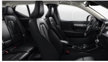
Leather Charcoal with Urban Grid Aluminium decor