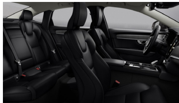
Fine Nappa Leather Perforated Charcoal with Grey Ash decor