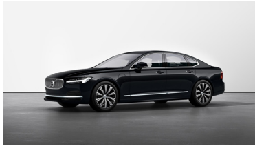
Onyx Black Metallic