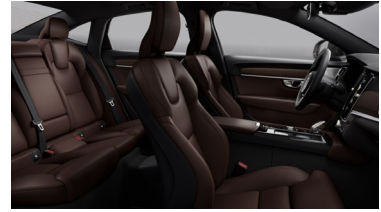
Fine Nappa Leather Perforated Maroon Brown with Pitched Oak decor