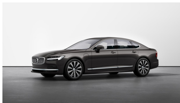
Platinum Grey Metallic