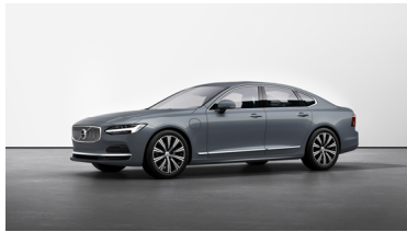
Thunder Grey Metallic