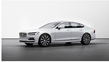
Crystal White Premium Metallic